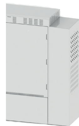
CCM MFG Climate Pack fügt sich unauffällig seitlich an das Connect Com MFG an